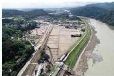
土砂が堆積した農地（球磨村）