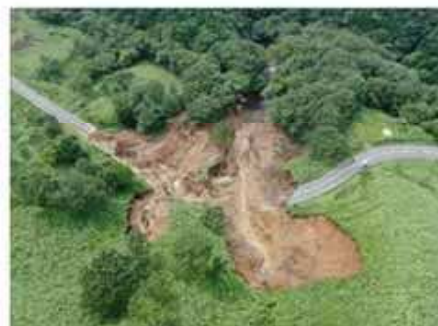
崩落した農道（南小国町）