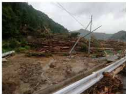
土砂が流入した農地（芦北町）