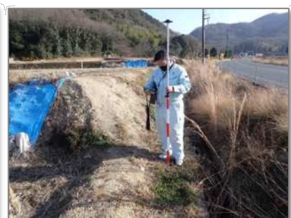
(GISで確認しながら測設)