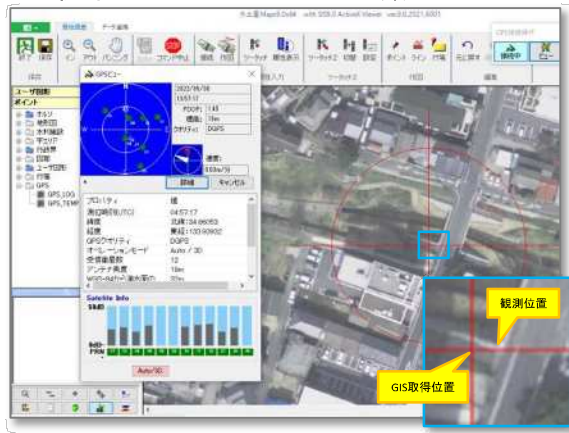
(平地で2m以内、山間地では10m程度)