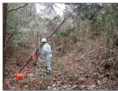
(山中でRTK測位位置をGIS上に表示)

また、ルート記録も可能なため、例えばため池調査における堤体アクセスルートをGISに蓄積することで、情報共有や次回調査の省力化にも繋がる。