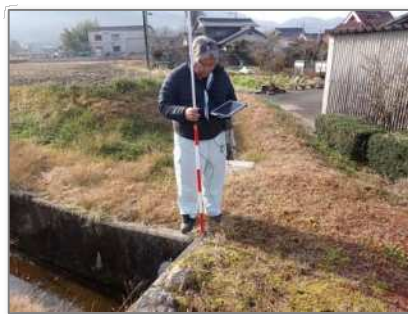
(GNSS基準点との比較:cm以内)