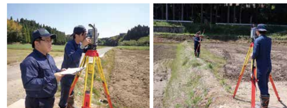
トータルステーションによる測量 (この測量で登記面積が確定します)