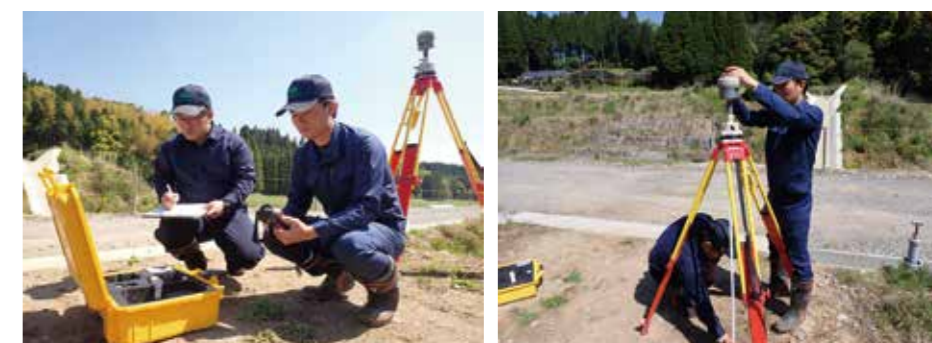
GNSSによる基準点測量 (人工衛星により位置情報を受信しています)