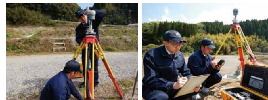
GNSSによる基準点測量 (人工衛星により位置情報を受信しています)