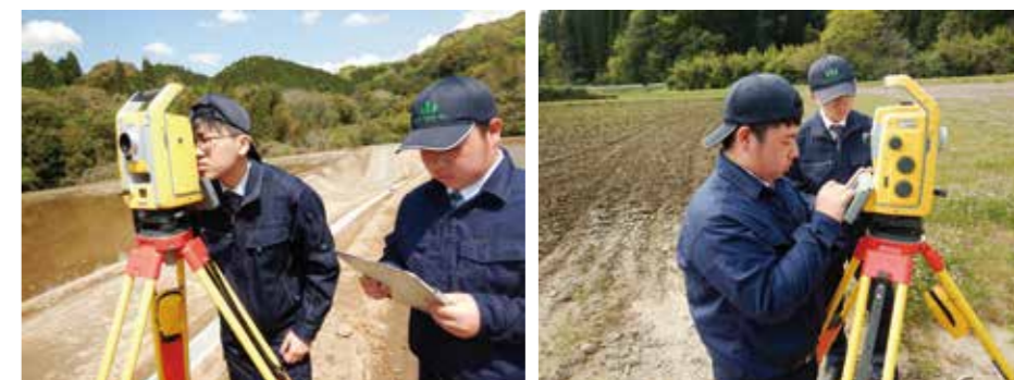
トータルステーションによる測量 (この測量で登記面積が確定します)