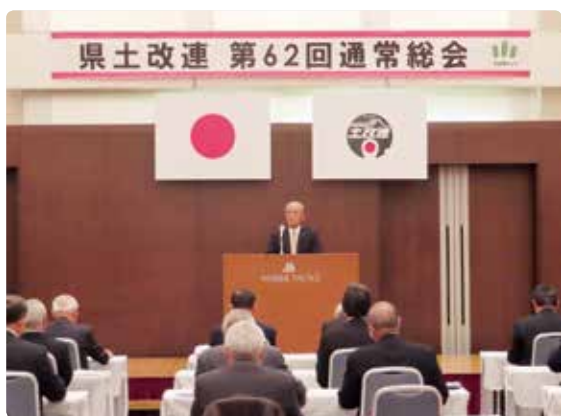
挨拶を述べる永吉会長

今回は、新型コロナウイルス感染拡大防止の政府方針を踏まえ、規模を縮小した形で行った。