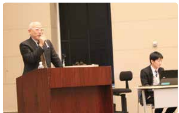
県農地整備課講師

研修会では、はじめに県農政部農地整備課の担当職員が、改めて「改正の概要」と「土地改良区の「義務事項と任意事項」について、法改正の目的に基づき説明を行った。