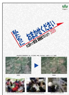
(左)2020水土里ネット鹿児島の概要「明日・農・夢」 (右)「私たちにおまかせください」 水土里ネット鹿児島 業務推進プロジェクト2020