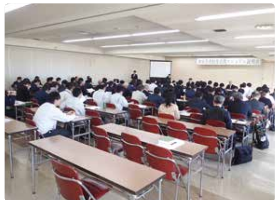
財産管理制度マニュアル説明会

最後に、昨年大島郡喜界町で、喜界町と農業委員会が連携し、改正農業経営基盤強化促進法を活用して共有者不明農地についての調査を実施し、その結果、6カ月間の共有者不明農地に係る公示手続きを行い、全国で初めて農地中間管理機構を通じた利用権の設定が実現した事例が報告された。