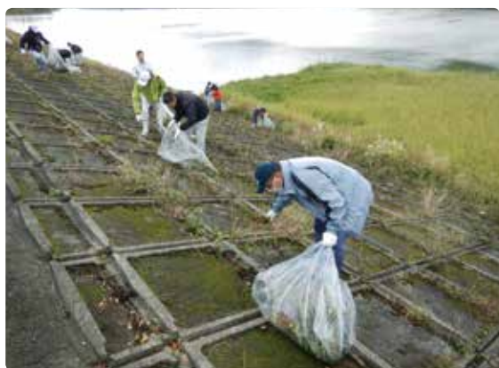
堤体に生えた雑草を取り除いていく

事務局による作業工程の説明が行われた後、堤体の草取りを行う班と、管理道路のゴミ拾いおよび伐採を行う班に分かれ、それぞれ作業に着手した。