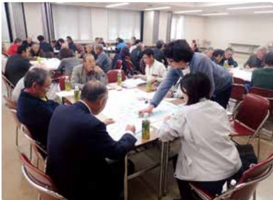
ワークショップの模擬体験

最後に各グループの代表が、今回のテーマに沿った話し合いの結果をそれぞれ発表した。時間が少ない中、どのグループも組織の現状と活動を継続する上での課題について、よく整理し、その具体策を立てていた。