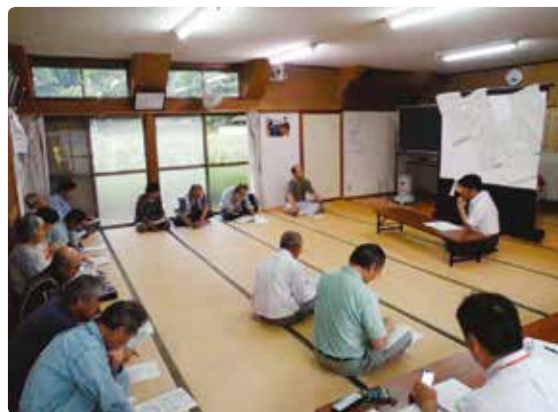
農事組合法人ひとつき

さらに、農地中間管理事業を活用して、農地の集積も進め、集団転作組合は平成16年に「一ツ木営農組合」へ組織再編し、平成24年には「農事組合法人ひとつき」として法人化した。農地中間管理機構を通してこの法人への集積を進め、事業で得た地域集積協力金は農作業機械や地域活動の資金に充てられている。