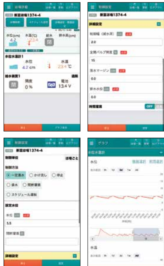
スマートフォンの操作画面

自動給水栓の導入により、スマートフォンやパソコンから水位、水温、給水栓の開閉状況を確認（20分おきにデータ更新）でき、設定の変更も可能となる。また、タイマーによる自動給水や、水位を自動で保つ一定湛水等に設定しておくことにより、操作のために直接ほ場まで行き、現地で給水栓を開閉する必要がなくなり、労力の削減が可能になる。さらに、常に適切な水管理を行うことで作物の品質向上や増収効果が期待されることや、無駄な給排水の抑制により土地改良区の水管理費（ポンプ代等）の軽減も見込めるなど、農家だけでなく土地改良区の負担軽減にも繋がる。