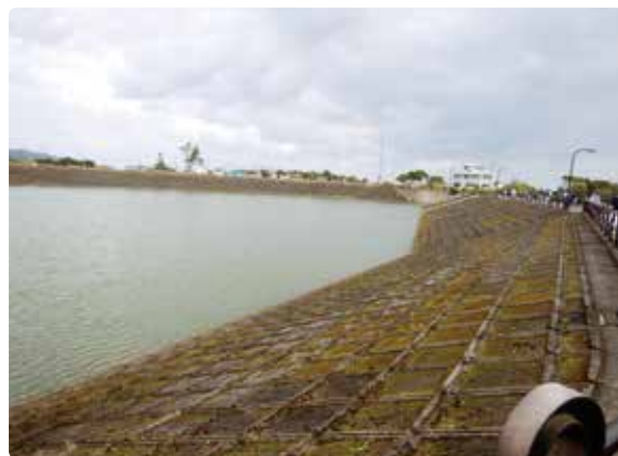
作業によってきれいになった堤体

堤体の斜面は雑草や苔が生えやすいため、参加者は足下に気をつけながら少しずつ草取りを行っていった。作業を開始して2時間ほど経った頃には堤体全体を覆うように茂っていた雑草はしっかりと取り除かれ、須野ダムは本来の荘厳な姿を取り戻した。