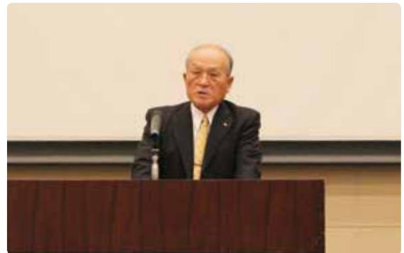
永吉会長あいさつ

他方、土地改良法改正に基づく土地改良制度の事務手続きの再編や改革が具体的に進められており各土地改良区でも鋭意取り組んでおられることと思うが、特に今回の法改正では対応すべき時期や内容、さらには制度を適用するか否かの決定など、土地改良区ごとに状況が異なるため混乱を招かないように適切に対応していかなければならない。