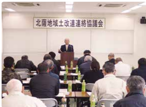
地域ごとに会員が集まった

地域土改連連絡協議会では、第62回通常総会提出議案の事前説明と決議案、本会役員の任期満了に伴う役員改選に対する、各地域における「役員選考委員」と「役員」の候補者選任を審議・決定した。