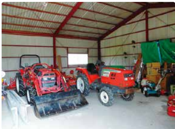
共同利用する農業機械

なお、公平性の確保と機械の修理費に充てるため、トラクターなどの大型機械は1時間500円、畔草刈機などの小型機械は1時間300円の使用料を徴収。さまざまな機械を負担の少ない金額で貸し出すことで、農家に無駄な個人投資はしないよう促している。