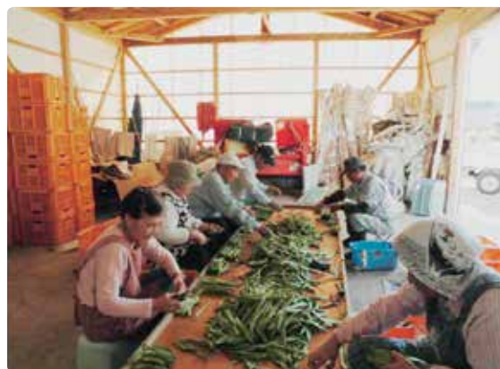
ジャンポインゲンの選別を行う高齢者

6次産業化への取り組みも始め、平成23年に県の地域振興事業を利用して加工施設を整備し、皮むき里芋やサツマイモのペーストを製造販売。現在は地元の学校給食や菓子店の原料として提供している。