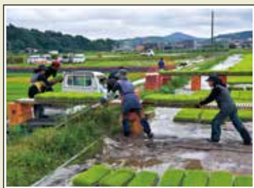
表紙写真 第28回かごしまフォト農美展 特選 田村 洋一「苗場の季節」 撮影場所:日置市伊集院町