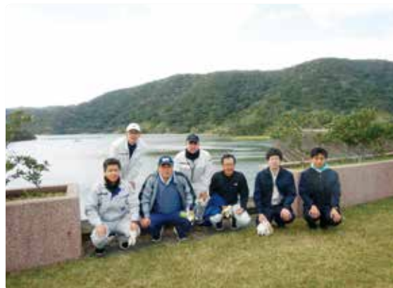
ダムを背景に作業終了後の記念撮影

大島事務所では、今後も、関係機関と連携しながら、さまざまな活動や行事等へ積極的に参加していきたい。そして、人々との交流を深めながら、地域への貢献と農業農村整備事業のさらなる推進を目指して邁進していきたいと思っている。