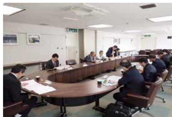
農地利用集積推進対策会議

同地区については、担い手の経営地近辺の農地を対象に、中間管理権を中心とした権利設定の啓発が必要と考えられることから、今後、関係機関と連携し、関係農家等に対する指導・助言を行うこととなった。